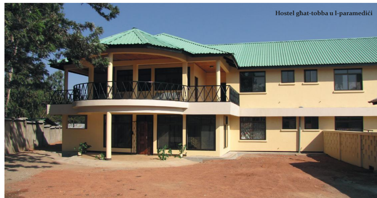
Hostel għat-tobba u l-paramediċi