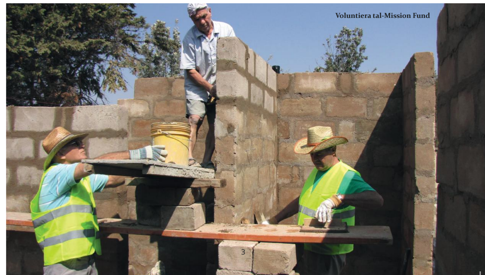
Voluntiera tal-Mission Fund