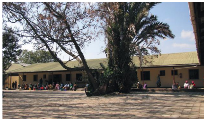
Sptar ta' Makiungu

Bħal li kieku dan ma kienx biżżejjed, il-Mission Fund wettqu proġett ieħor fl-2015 meta l-voluntiera reggħu ġew biex jgħinu fil-bini ta' staff house f'dan l-isptar. Jiena, f'isem shabi s-sorijiet kollha, nixtieq nuri l-apprezzament tagħna għall-għajnuna kbira li rċevajna mill-Mission Fund. Għalhekk inhegġgħom biex tkomplu turu l-generozità kbira tagħkom lejn il-Mission Fund halli jkompli jsir aktar ġid b'risq il-missjunarji kollha Maltin u Ghawdxin. Il-Mulej ipattikom għal mitt darba.