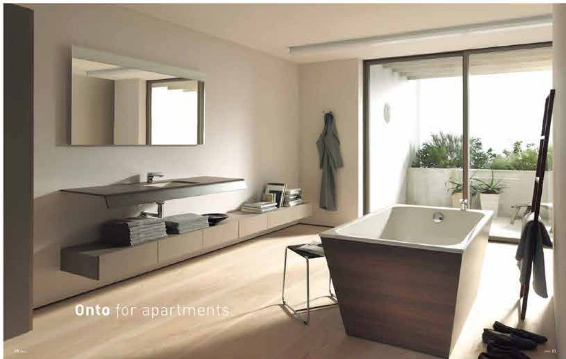
Onto for apartments